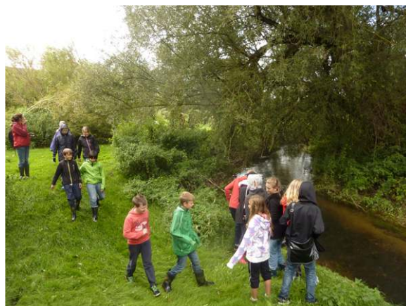
Dösjebro. Elever går ner i den gamla rätade å-färan och ser hur återmeandringen förändrat ån.