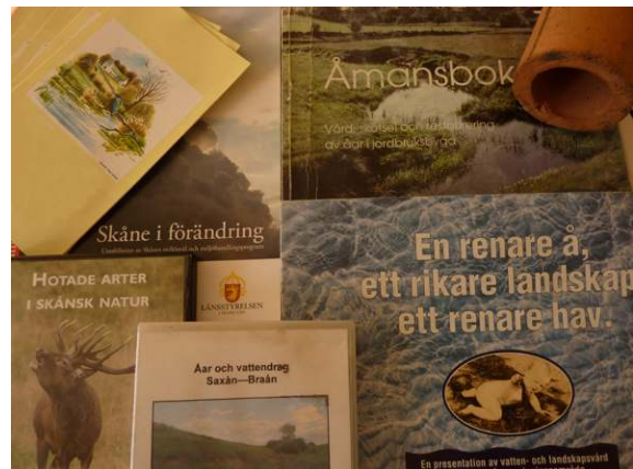
Material på temat visas upp: broschyrer om besöksvärda naturområden längs ån, Åmansboken, video.