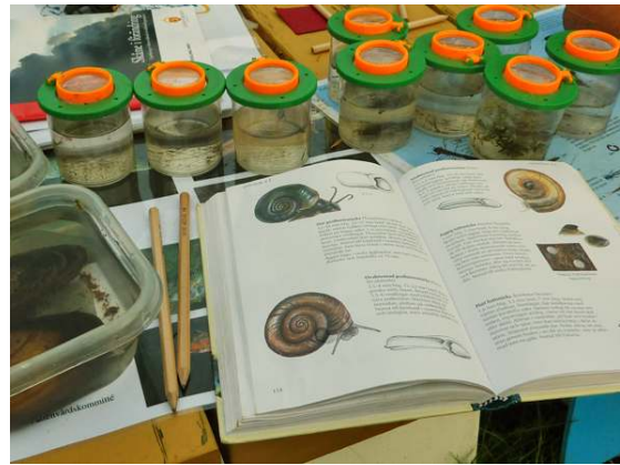
Eleverna använder luppar och bestämningsmaterial och vi pratar tillsammans om vad vi hittat.