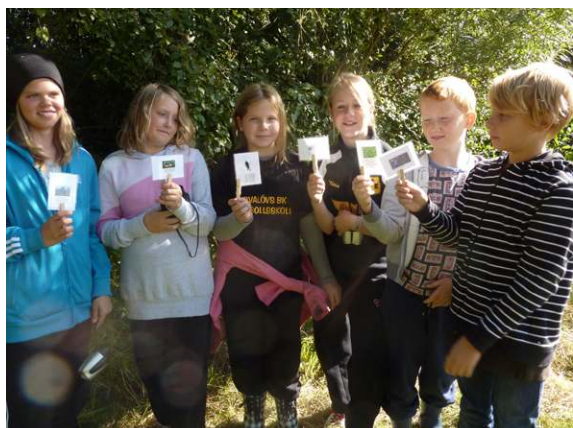
Häljarp. Eleverna har bildat en näringskedja av djur och växter som man vanligtvis kan hitta vid och i vatten.

Besökarnas åldersfördelning på turerna 2010-2013. Totalt 1412 besökare.