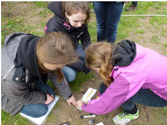
Högstadielklass mäter kvävehalten i dammen och ån. Häljarp.