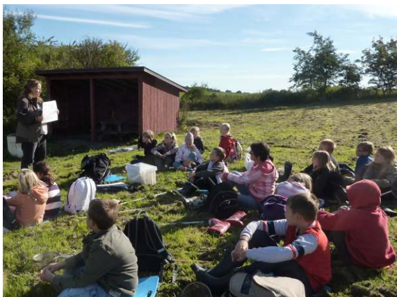
Besökarna tar del av en berättelse om hur utdikningen gick till och vilka följderna blivit. Marieholm.

Syftet med informationsturena är att berätta om hur människan förändrat landskapet under de senaste århundradena, vad detta fått för följder för vattenkvalitet, landskapets vattenhållande förmåga och biologisk mångfald och hur Saxån-Braåns Vattenvårdskommitté arbetar med dessa frågor längs ån. Förhoppningen är att detta i förlängningen kan ge ökat engagemang hos allmänheten och underlätta vid framtida vattenvårdande åtgärder. Turerna går i linje med Länsstyrelsens riktlinjer att resurser behöver avsättas för information som ger ökad insikt och engagemang i samhället om varför olika vattenvårdande åtgärder behövs.