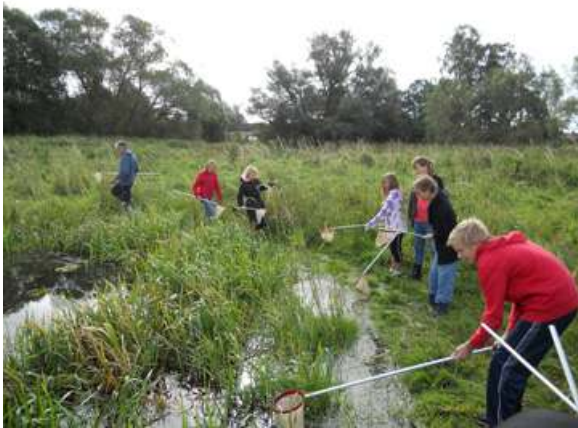
Vattenscorpioner, trollsländelarver, posthornssnäcker, hästglar och igelknopp i en damm på betesmark i Dösjebro.