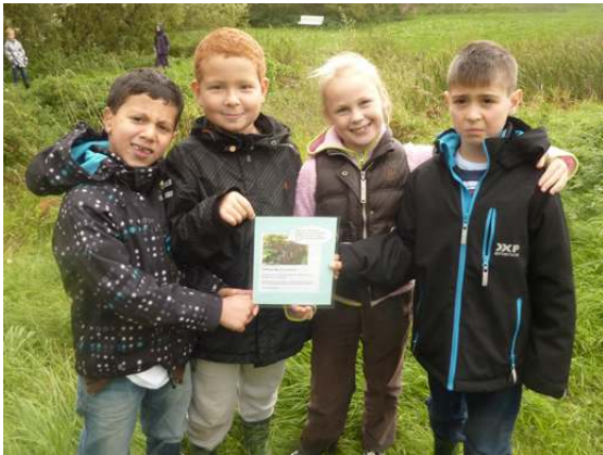
Vi letar efter boplatser för fladdermöss och grodor här vid ån! Korten beskriver vad djuren behöver.