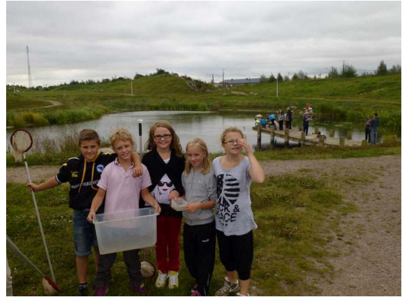
Klass från Teckomatorp besöker Vallarna, ett f d förorenat område som gjorts om till ett natur- och friluftsområde.