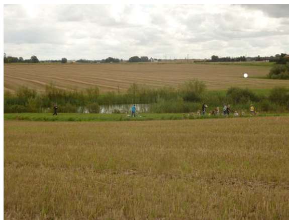
Damm som tar emot dräneringsvatten från åkermark. Marieholm. Håvning och tipsrunda om vattenvård.