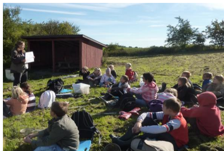
Hur var det att leva här i Marieholm för 200 år sedan? Varför började man dika ut?

Målet är att detta i förlängningen kan ge ökat engagemang hos allmänheten och underlätta vid framtida vattenvårdande åtgärder. Turerna går i linje med Länsstyrelsens riktlinjer att resurser behöver avsättas för information som ger ökad insikt och engagemang i samhället om varför olika vattenvårdande åtgärder behövs.