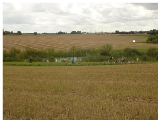
Elever vid en våtmark på åkermark i Marieholm.

Hur var det att leva här i Marieholm för 200 år sedan? Varför började man dika ut? Vad har det fått för följder idag?