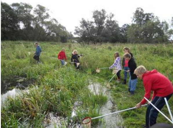
Vattenscorpioner, sländlarver, posthornsnäckor och liten vattensalamander...hur lever djuren? Hur är de beroende av varandra i näringsvävar?

Fokus är att deltagarna ska få uppleva allt liv som finns i och vid ån och våtmarkerna. De blir visade de fina exkursionsmålen och promenadstigarna som anlagts längs ån. Genom mera kunskap ökar intresset och förståelsen för att bevara och sköta åar och våtmarker. När kunskapen om det ökar i samhället så blir det också lättare i förlängningen att genomföra åtgärder. ”Det är viktigt att resurser avsätts för information som ger ökad insikt och engagemang i samhället om varför olika vattenvårdande åtgärder behövs.” (Miljötilståndet i Skåne, temanummer Vatten, 2005)