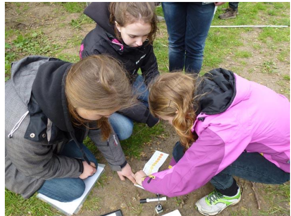
Hur mycket nitrat finns det i den anlagda dammen respektive ån? Vad har hänt med vattnet sedan det passerat dammen?