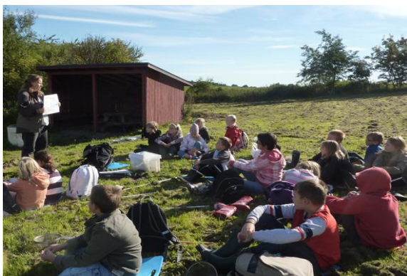
Hur var det att leva här i Marieholm för 200 år sedan? Varför började man dika ut? Vad har det fått för följder idag?

Målet är att detta i förlängningen kan ge ökat engagemang hos allmänheten och underlätta vid framtida vattenvårdande åtgärder. Turerna går i linje med Länsstyrelsens riktlinjer att resurser behöver avsättas för information som ger ökad insikt och engagemang i samhället om varför olika vattenvårdande åtgärder behövs.