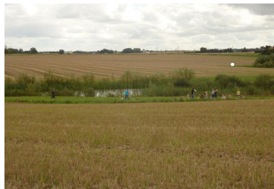
Elever vid en våtmark på åkermark i Marieholm.

435 personer har besökt Saxån-Braån under årets turer. Totalt har 3305 personer besökt ån på exkursioner sedan 2010 då turerna började. Se ålderfördelningen på besökarna genom åren nedan. Besökarna har kommit från Landskrona (24%), Kävlinge (25%), Svalöv (21%) och Eslöv (30%).