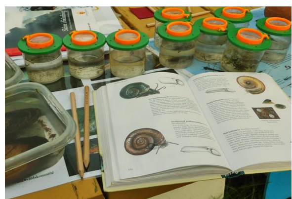
Vilka växtätare, rovdjur och nedbrytare hittar vi?